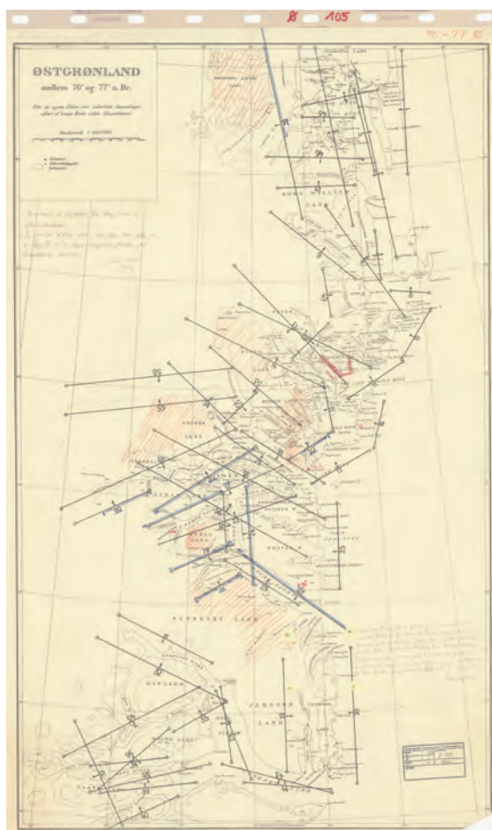
Rutekort af flyfotos, 1975. GEUS Kortarkiv, nr. Ø 105. 1949-1958, 00047.

I forbindelse med sanatorierne var der ofte etableret såkaldte liggesale (også kaldet liggehaller). Liggesalene bestod som regel af en halvcirkulær væg med tag og tre sider, så der var åbent på den langside, der vendte mod solen. Her lå patienterne på brikse og hvilede sig, når vejret var til det, simpelthen fordi man mente, at den friske luft ville afhjælpe sygdommen (se side 85). Det kan man bl.a. læse mere om hos eksempelvis Dansk Sygeplejehistorisk Museum,