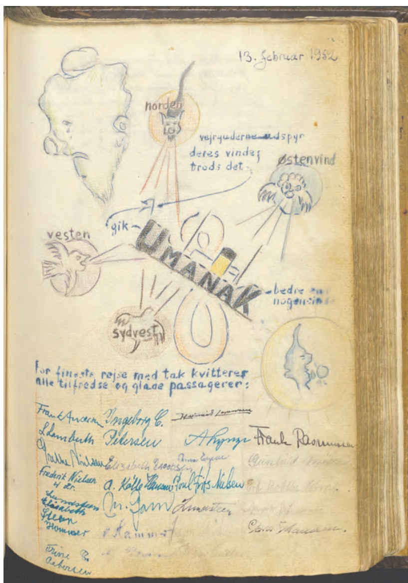
Gæstebog fra M/S Umanak, 1949-1958. Nunatta Katersugaasivia Allagaateqarfialu, nr. 0792-1, 1949-1958, 00047.

Noten er i øvrigt udateret, men antageligvis fra 1932-33. Norge okkuperede som bekendt et område af Nordøstgrønland i 1931 (som de navngav Erik den Rødes Land), og indsatte året efter Helge Ingstad som guvernør samme sted. Ingstad må derfor være den norske politimester, som Koch refererede til i noten.